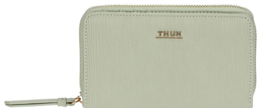
Portafoglio Thun in ecopelle medio verde Bigiotteria e Accessori Thun